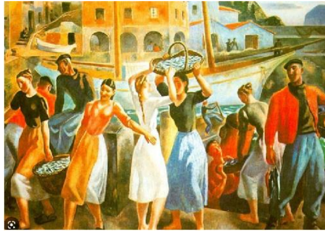
LOS GUARDIANES DEL MAR

REIVINDICAR NUESTRA APORTACION A LA BIODIVERSIDAD